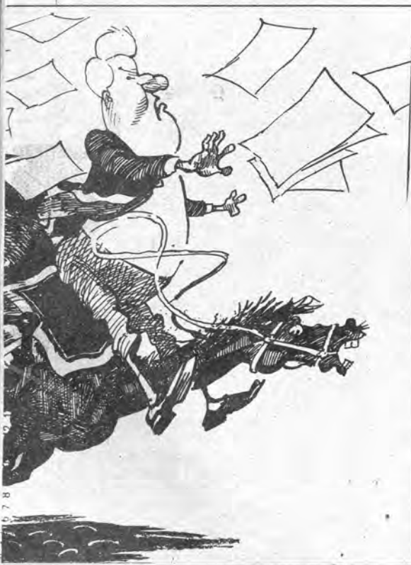
Рисунок Владимира Мочалова